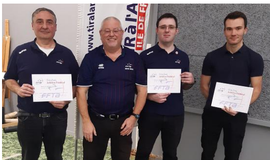
Au centre avec ses 3 nouveaux arbitre du 78.